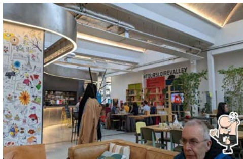
Restaurant: Le Sésame